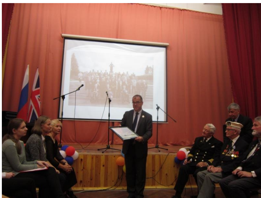
Вручение памятных наград генеральным консулом Великобритании в Санкт-Петербурге К. Алланом