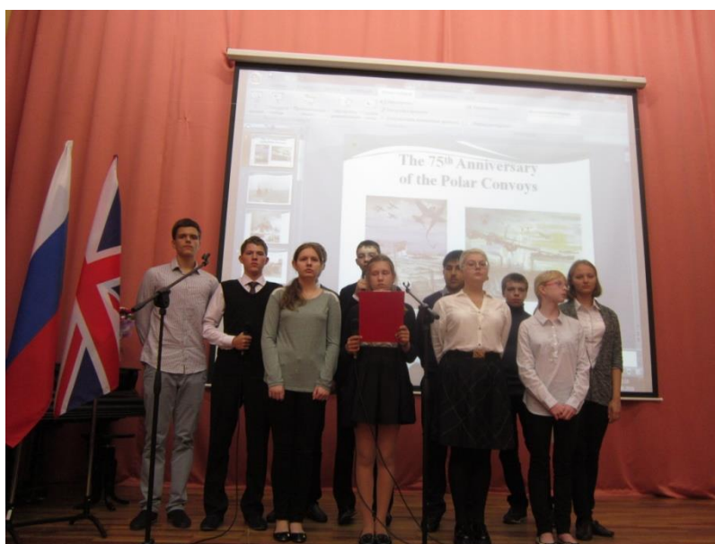
Выступление учеников 9 гимназии 3 сентября 2016 г. в г. Санкт-Петербург