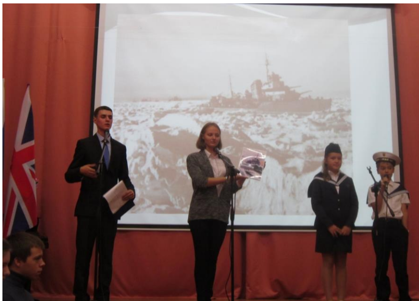
Презентация сборника «Северная сага»