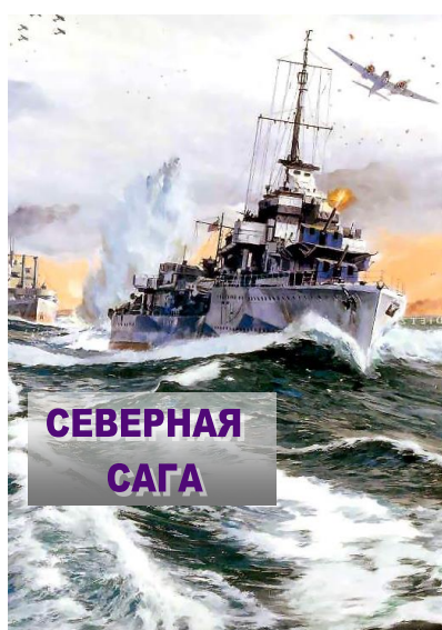
Обложка сборника «Северная сага»

Активисты музея истории Полярных конвоев, который был открыт в гимназии № 9 г. Мурманска, работали над проектом вместе с учениками школы № 600 г. Санкт-Петербурга. Итогом проекта стал сборник «Северная сага». Сборник содержит рисунки, статьи, эссе учащихся на русском и английском языках.