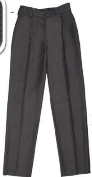
13Ш2-БРМ386-03 13Ш3-БРМ386-03 13Ш2-БРМ389-03 13Ш3-БРМ389-03 утепленные