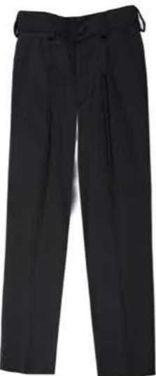
13Ш2-БРМ388-01 13Ш3-БРМ388-01 утепленные