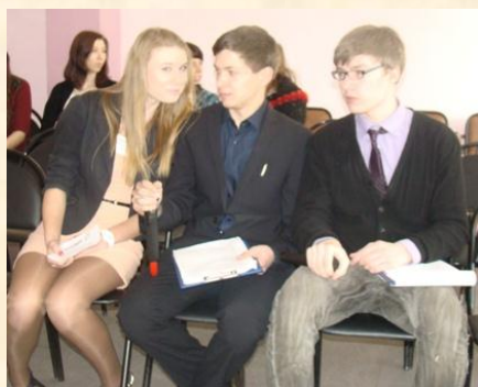
Организаторы концертной программы