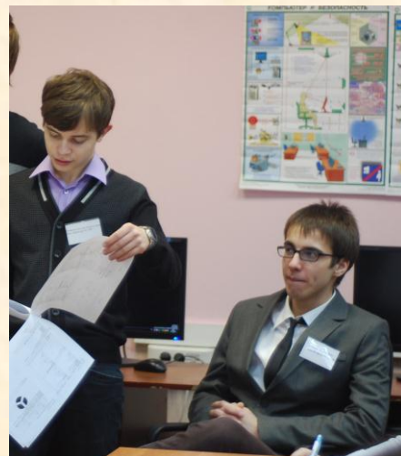
Заместители директора по УВР