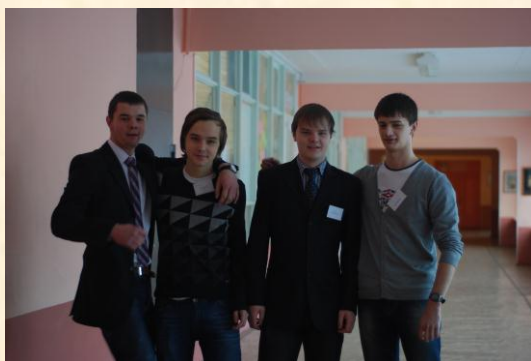
сотрудники службы охраны

Администрация успешно справилась с организацией учебно-воспитательного процесса в День самоуправления, решала проблемы по мере их поступления, а также морально поддерживала всех, кто в этот день, конечно, волновался.