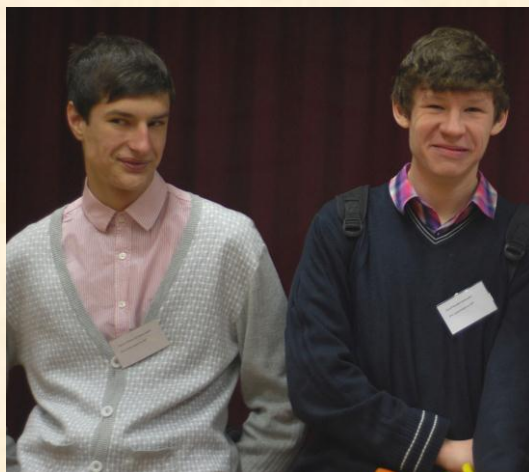
Заместители директора по УВР