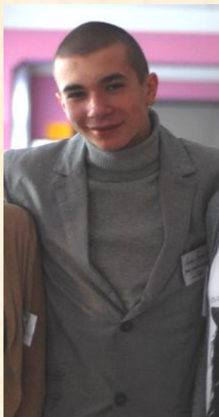
Заместитель директора по УВР